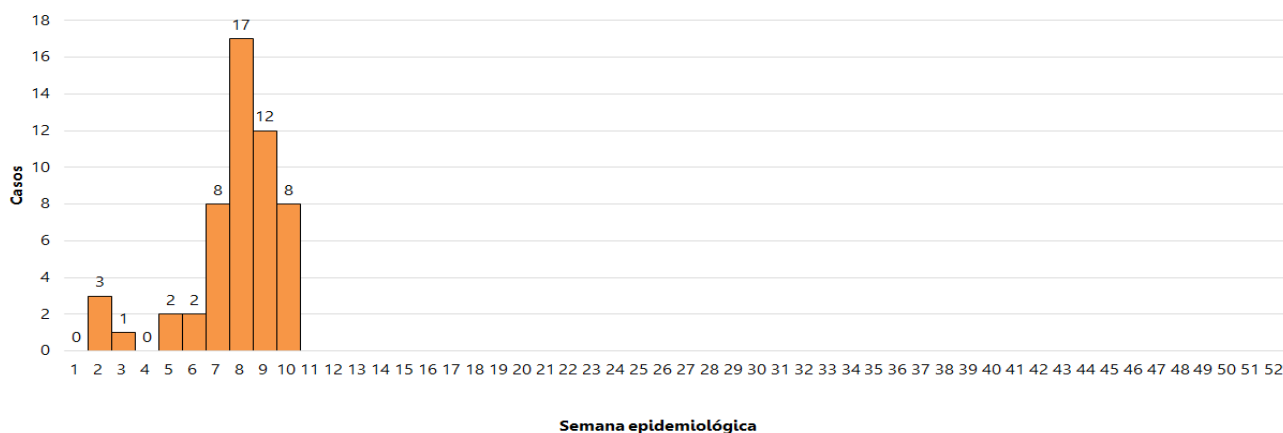
Vigilancia de Arbovirosis. Curva epidémica. Departamento de Concepción_ Paraguay Año 2019

Se observa que en las primeras 6 semanas se registraron menos de 5 notificaciones y a partir de la semana de la semana 7 aumentaron las notificaciones de casos sospechosos de arbovirosis.