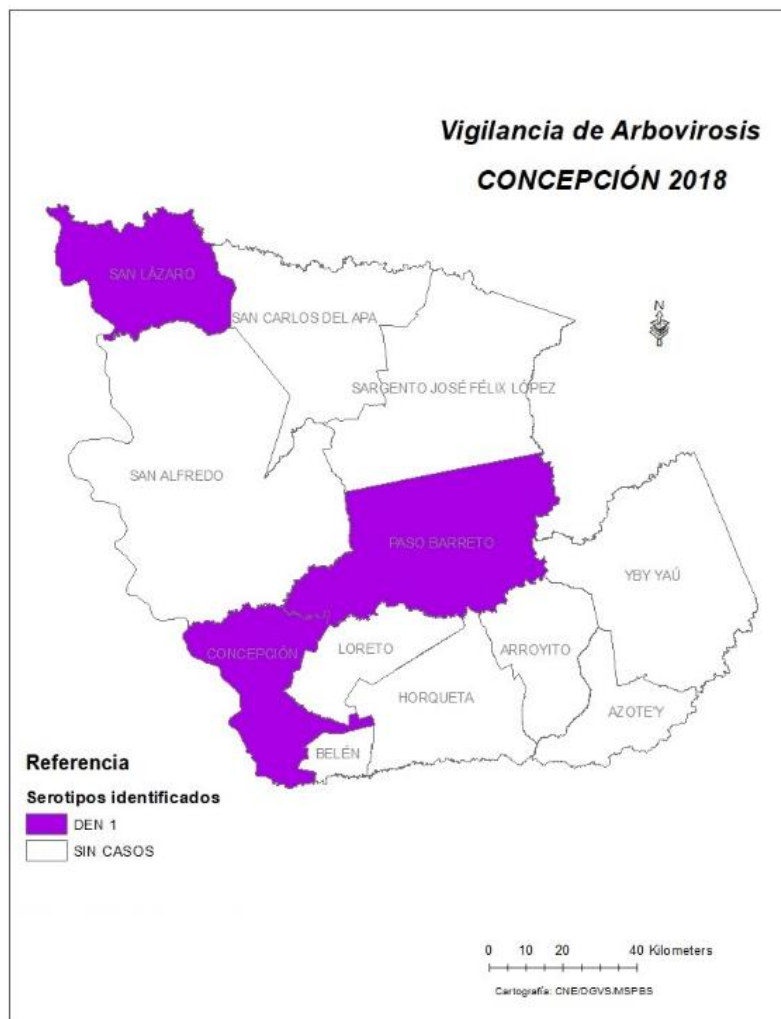
Mapa 1: Distribución geográfica de los casos confirmados por distrito-Concepción -Año 2018

No se evidenció la circulación de las otras Arbovirosis: chikungunya y Zika en la región.