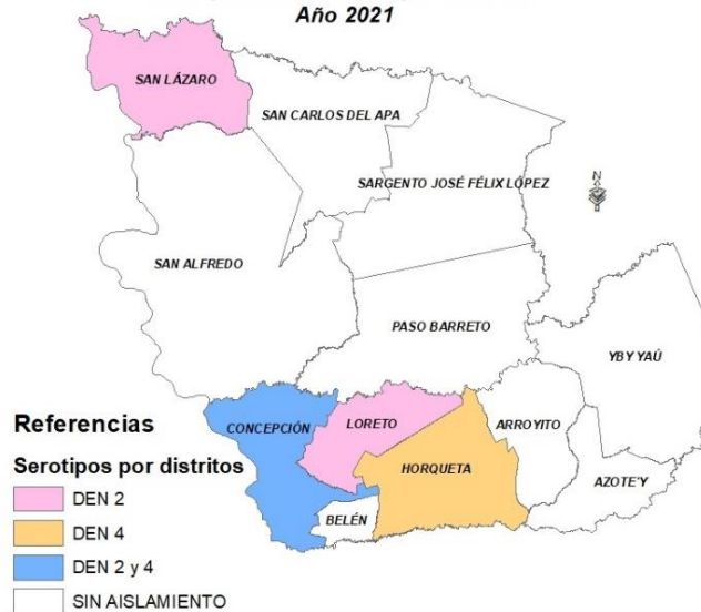
CONCEPCIÓN VIGILANCIA DE DENGUE Serotipos identificados por distritos Año 2021