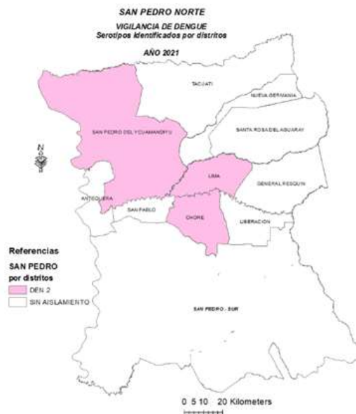
MAPA 1: VIGILANCIA DE DENGUE

En San Pedro (A.P. Norte), se identificó la circulación de los serotipos en el distrito de Lima, Chore y San Pedro de Ykuamandyju.