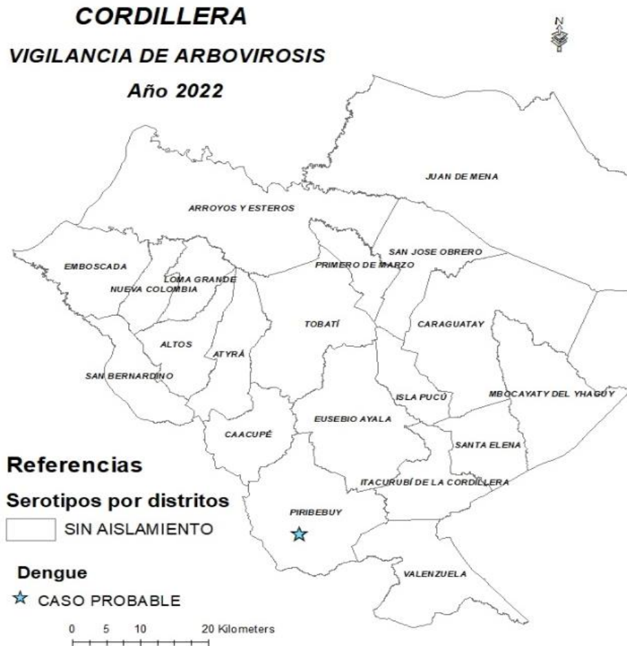
Mapa 1. Distribución geográfica de arbovirosis

En lo que va del año 2022, hasta el corte de esta edición, no se identificaron serotipos de dengue, ni la circulación activa de ninguna de las Arbovirosis. Sin embargo, se captó un caso probable de dengue en la SE 1, en el distrito de Piribebuy.