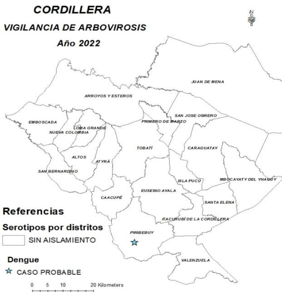
Mapa 1. Distribución geográfica de arbovirosis

En lo que va del año 2022, hasta el corte de esta edición, no se identificaron serotipos de dengue, ni la circulación activa de ninguna de las Arbovirosis. Sin embargo, se captó un caso probable de dengue en la SE 1, en el distrito de Piribebuy.