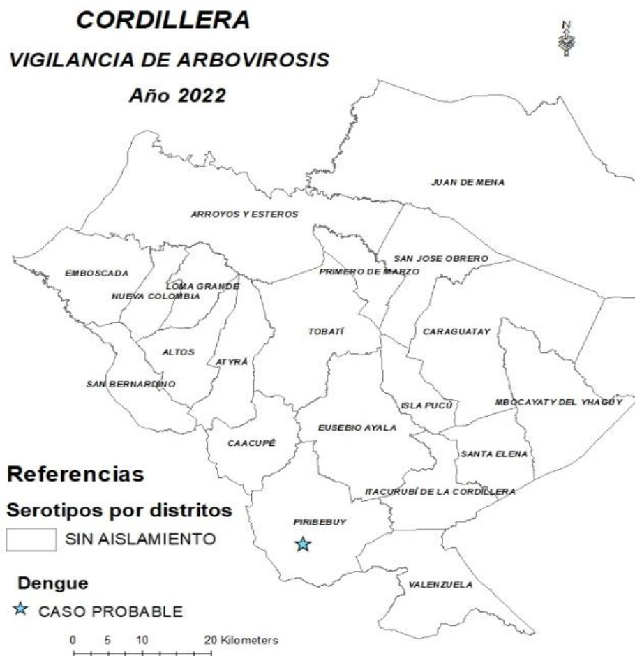
Mapa 1. Distribución geográfica de arbovirosis

En lo que va del año 2022, hasta el corte de esta edición, no se identificaron serotipos de dengue, ni la circulación activa de ninguna de las Arbovirosis. Sin embargo, se captó un caso probable de dengue en la SE 1, en el distrito de Piribebuy.