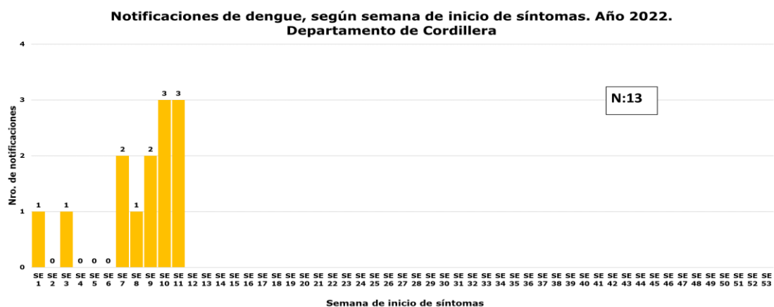
Gráfico 1. Dengue. Número de notificaciones en el departamento de Cordillera. SE 1 a la SE 12, año 2022.