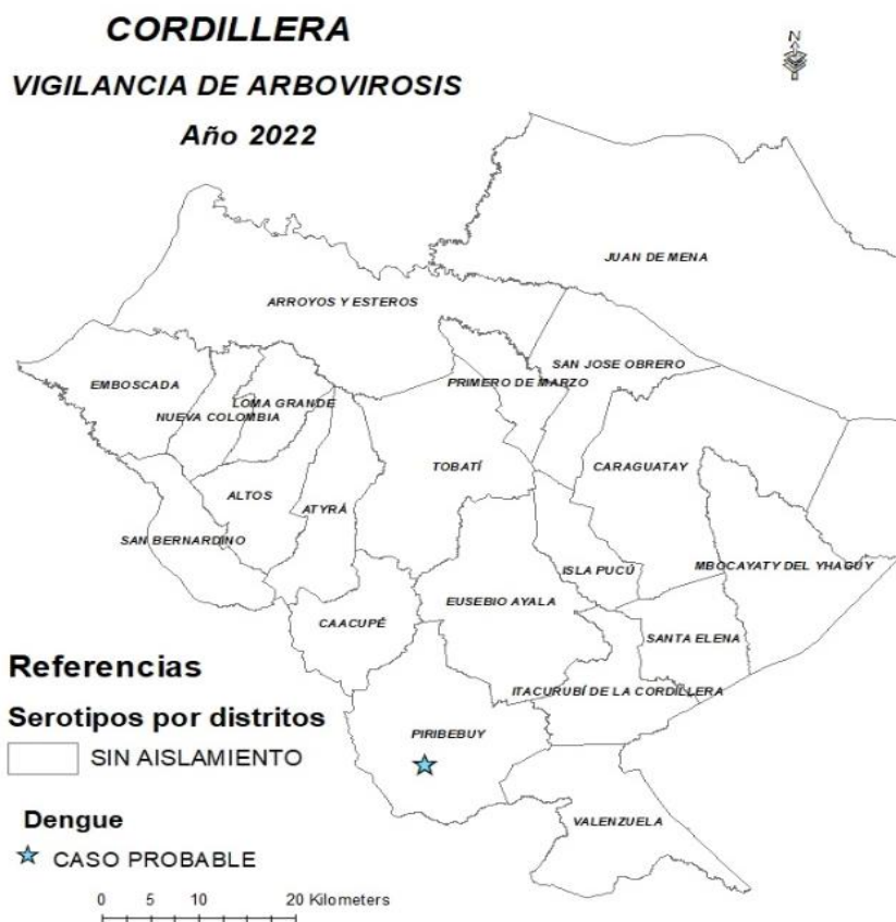
Mapa 1. Distribución geográfica de arbovirosis

En lo que va del año 2022, hasta el corte de esta edición, no se identificaron serotipos de dengue, ni la circulación activa de ninguna de las Arbovirosis. Sin embargo, se captó un caso probable de dengue en la SE 1, en el distrito de Piribebuy.