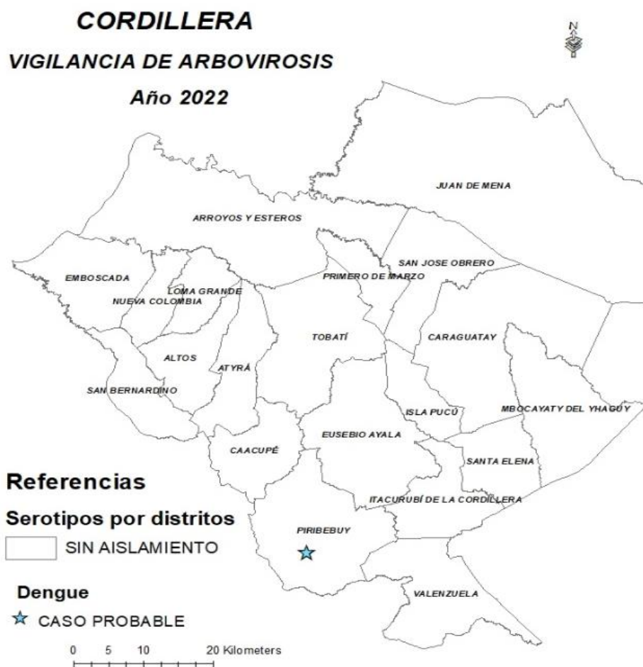
Mapa 1. Distribución geográfica de arbovirosis

En lo que va del año 2022, hasta el corte de esta edición, no se identificaron serotipos de dengue, ni la circulación activa de ninguna de las Arbovirosis. Sin embargo, se captó un caso probable de dengue en la SE 1, en el distrito de Piribebuy.