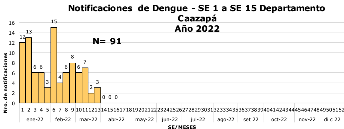
Gráfico 1. Dengue. Número de notificaciones desde la SE 1 a la SE 15, departamento de Caazapá, año 2022