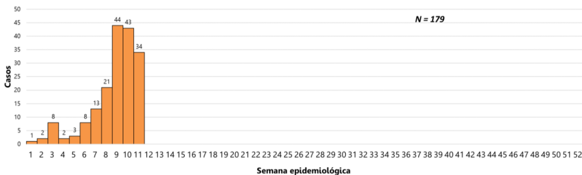
Vigilancia de Arbovirosis. Curva epidémica. Departamento de Itapúa - Paraguay. Año 2019