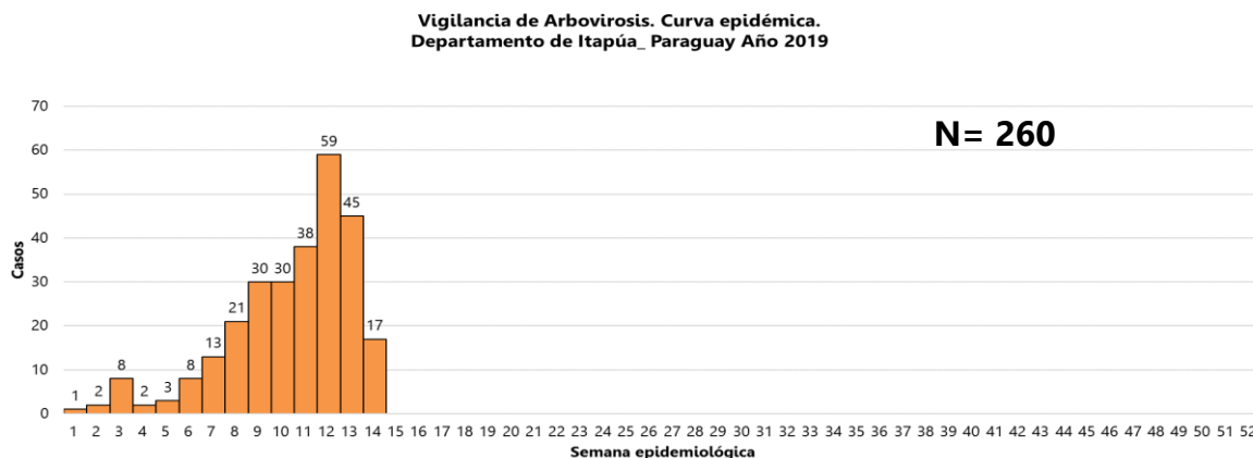
Gráfico 2: Total de casos confirmados y probables de Dengue. SE 1 a la SE 13