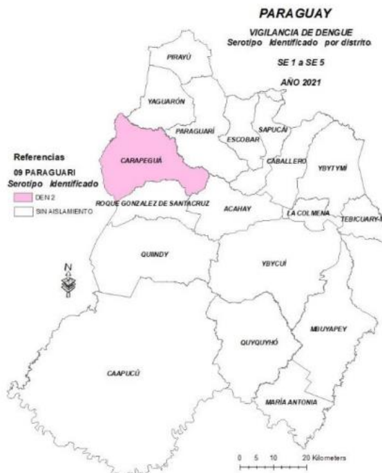
MAPA 1: VIGILANCIA DE DENGUE, CIRCULACIÓN VIRAL POR DISTRITO. DEPARTAMENTO DE PARAGUARÍ, 2021

A la SE 13 se ha identificado circulación viral de DENV-2 en el distrito de Carapeguá. En los demás distritos del departamento no se ha determinado aún la circulación de ningún serotipo. (Mapa 1).