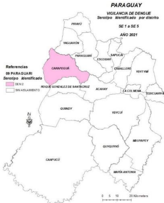
MAPA 1: VIGILANCIA DE DENGUE, CIRCULACIÓN VIRAL POR DISTRITO. DEPARTAMENTO DE PARAGUARÍ, 2021

A la SE 15 se ha identificado circulación viral de DENV-2 en el distrito de Carapeguá. En los demás distritos del departamento no se ha determinado aún la circulación de ningún serotipo. (Mapa 1).