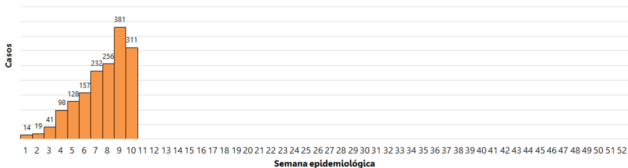
Vigilancia de Arbovirosis. Curva epidémica. Departamento de Alto Parana_ Paraguay Año 2019

Se registra un aumento de notificaciones en forma gradual desde en las primeras cuatro semanas del año 2019. En la SE 9 se registró el mayor número con 381 notificaciones de arbovirosis.