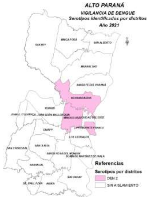
Mapa 1 (se reemplaza el mapa)

Se identifica DEN-2 en los distritos de Presidente Franco, Hernandarias y Minga Guazú