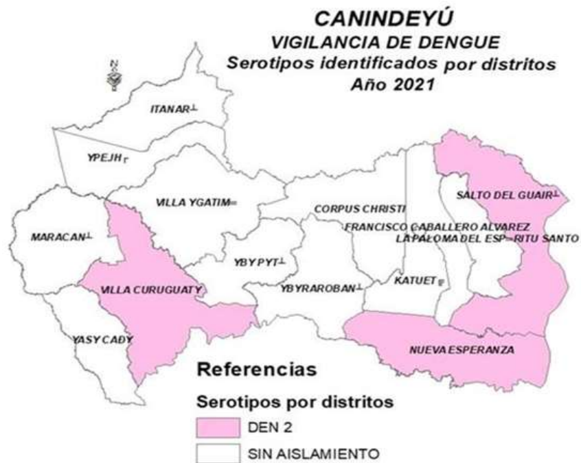
MAPA 1: VIGILANCIA DE DENGUE

En la región de Canindeyú se identificó la circulación DEN-2 en: Curuguaty, Salto del Guairá y Nueva Esperanza.