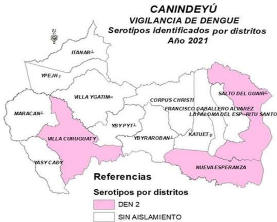
MAPA 1: VIGILANCIA DE DENGUE

En la región de Canindeyú se identificó la circulación DEN-2 en: Curuguaty, Salto del Guairá y Nueva Esperanza.