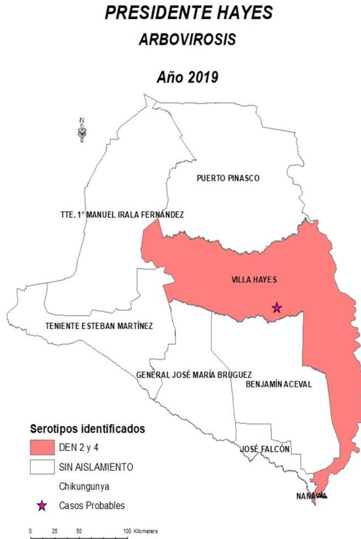
Mapa 1. Distribución por distrito de la vigilancia Arbovirosis según: Serotipo de Dengue identificado en Presidente Hayes, año 2019.

El mapa cartográfico, a escala de 0 a 100 kilómetros, señala la co-circulación de DEN-2 y DEN-4 en el distrito de Villa Hayes; el resto de los distritos sin identificación de serotipos.