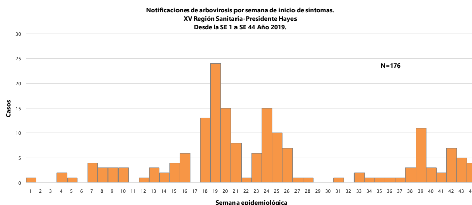
Gráfico 2. Curva de notificaciones desde la SE 1 a la SE 44 de Arbovirosis en la XV Región Sanitaria-Presidente Hayes, año 2019.

Este gráfico presenta el número de notificaciones de pacientes que iniciaron síntomas en determinada semana epidemiológica. Se presenta en el eje de abscisas, las semanas epidemiológicas desde la SE 1 a SE 44 y en el eje de ordenadas el número de casos. Se observa una distribución asimétrica y el pico máximo en la SE 19.