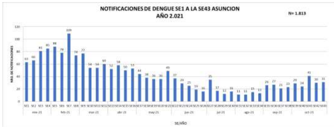
GRÁFICO 1. DENGUE. NOTIFICACIONES DESDE LA SE 1 2021 A LA SE 43 2021 ASUNCIÓN, AÑO 2021

Este gráfico presenta el número de notificaciones de dengue por semana de inicio de síntomas, excluyendo los descartados.