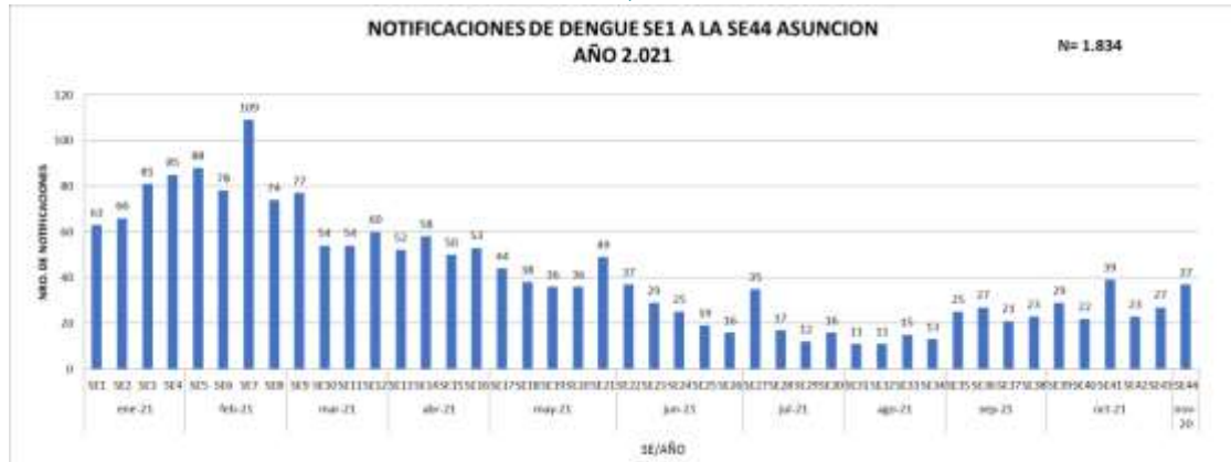
GRÁFICO 1. DENGUE. NOTIFICACIONES DESDE LA SE 1 2021 A LA SE 44 2021 ASUNCIÓN, AÑO 2021

Este gráfico presenta el número de notificaciones de dengue por semana de inicio de síntomas, excluyendo los descartados.