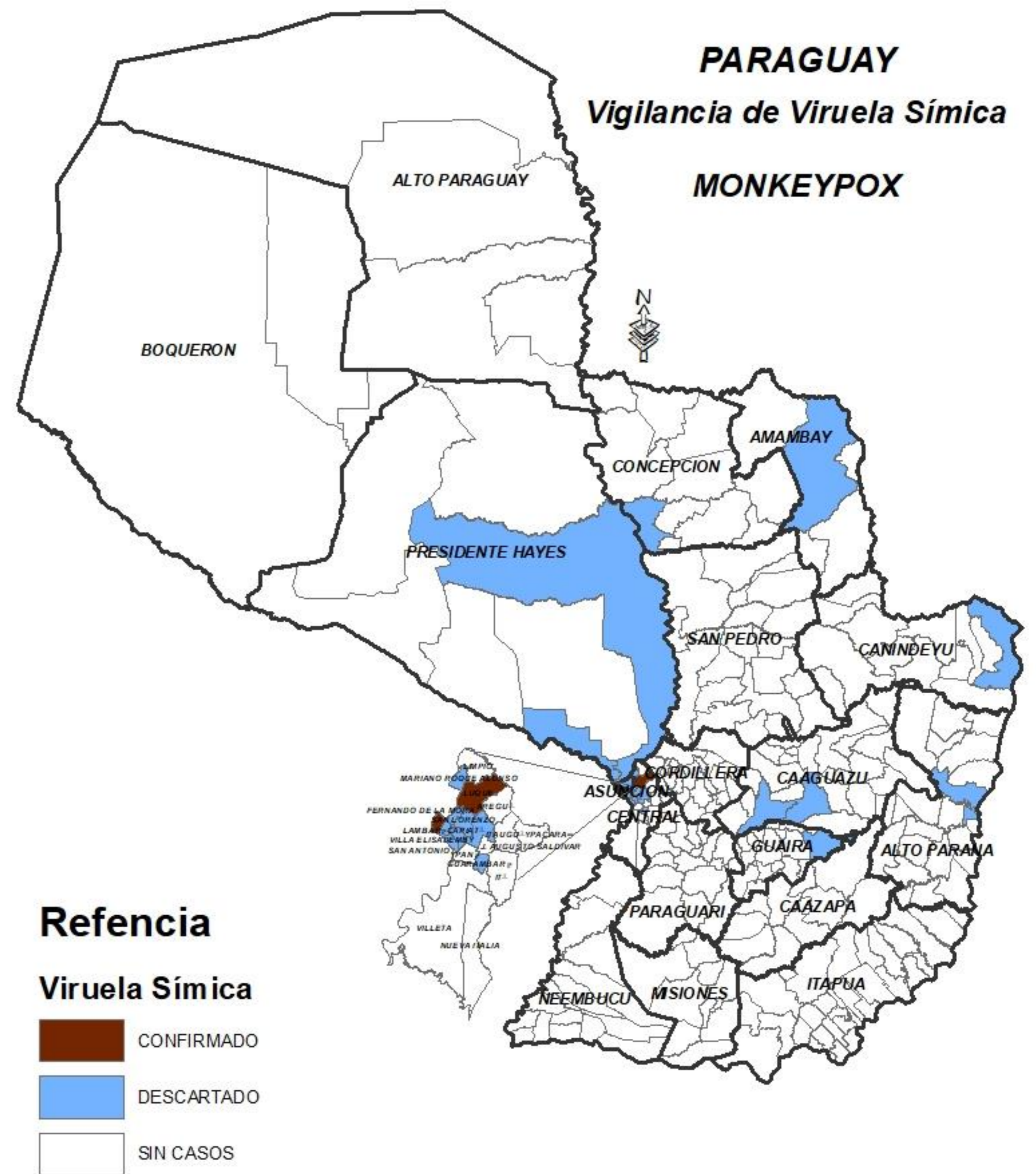
VIRUELA SÍMICA. Notificaciones de casos confirmados, sospechosos y descartados, según semana de inicio de síntomas. Paraguay. Desde mayo (SE 20) a la SE 43. Año 2022.