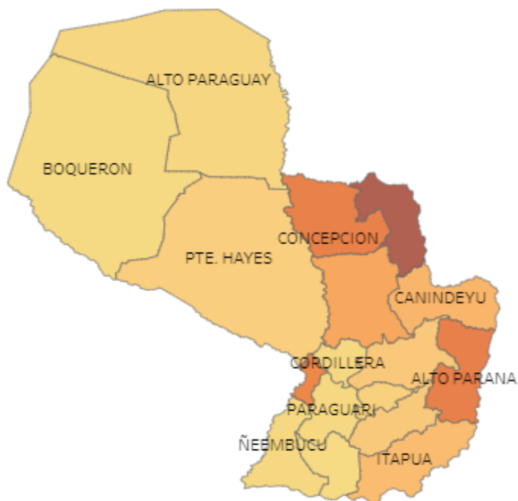
Mapa 3. Homicidios, Paraguay, año 2021.