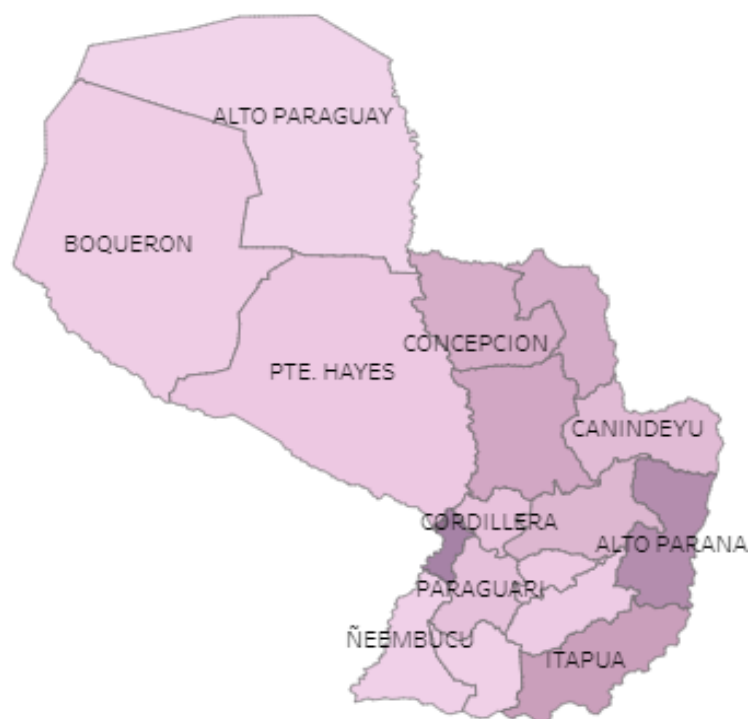
Mapa 1. Causa Externas (Accidentes de tránsito, homicidios y suicidios), Paraguay, año 2021

Fuente de datos: Subsistema de Información y Estadísticas Vitales (SSIEV)