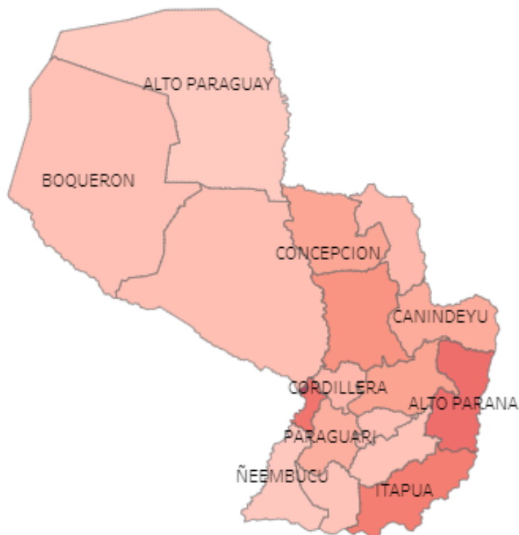
Mapa 2. Siniestros viales, Paraguay, año 2021

Fuente de datos: Subsistema de Información y Estadísticas Vitales (SSIEV)