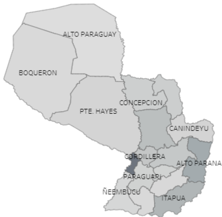
Mapa 4. Suicidios, Paraguay, año 2021

Fuente de datos: Subsistema de Información y Estadísticas Vitales (SSIEV)