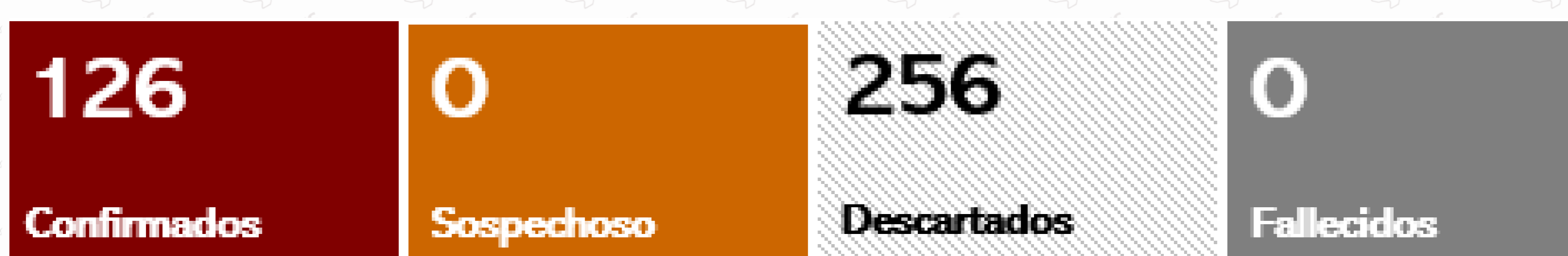
Tabla 2. Casos confirmados reportados por años: