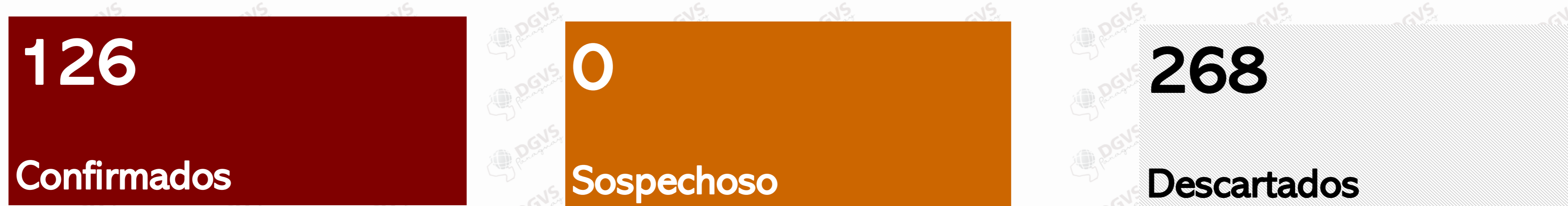
Tabla 2. Casos confirmados reportados por años: