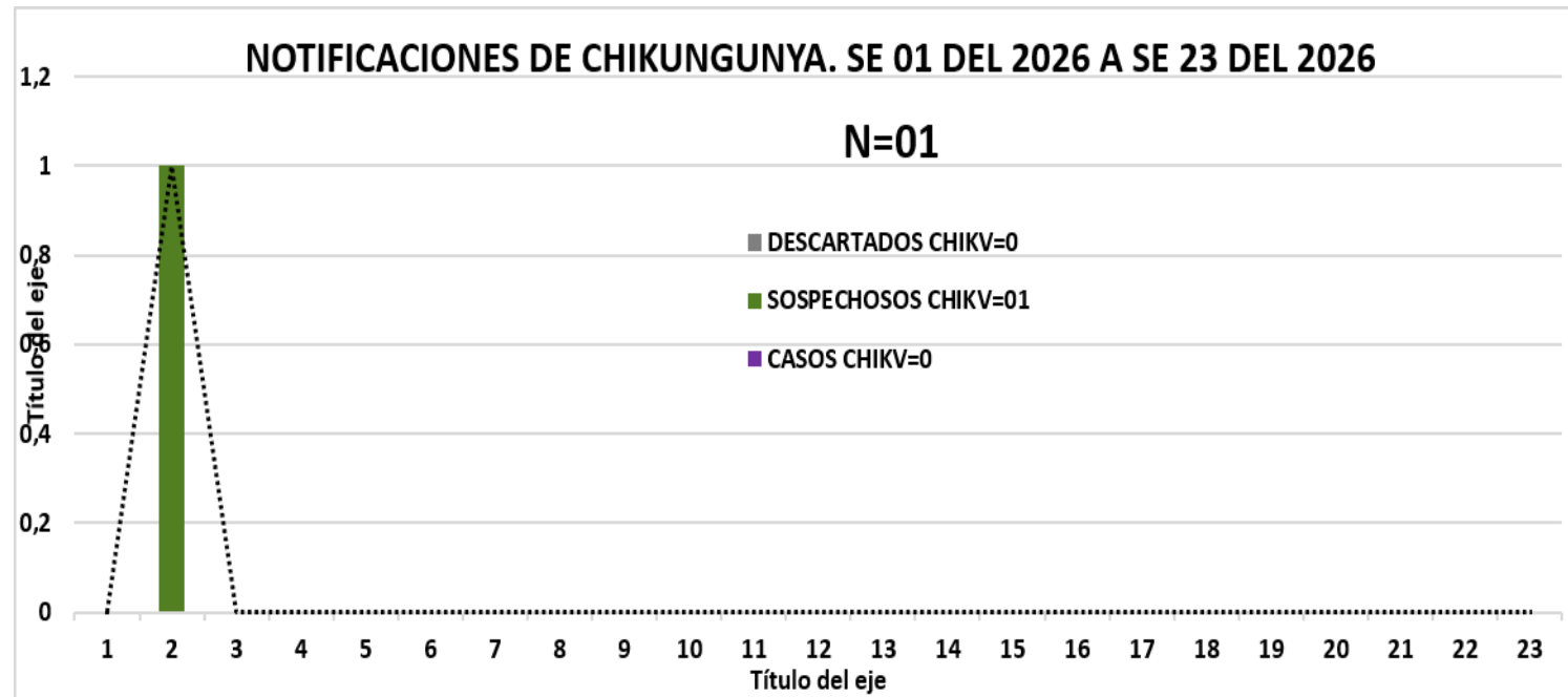
GRAFICO 1. CURVA DE NOTIFICACIONES DE CHIKUNGUNYA. SE 01 DEL 2026 A SE 23 DEL 2026 NOVENA REGION SANITARIA PARAGUARÍ